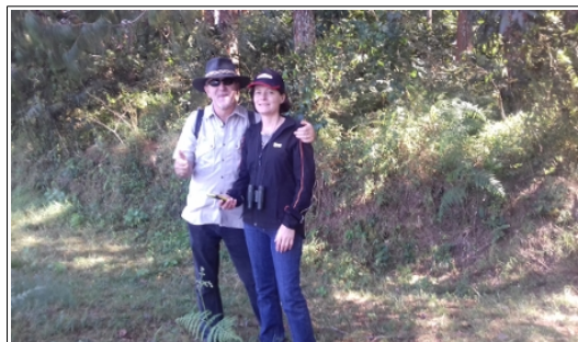
Ausflug auf dem Zomba Plateau

Trotz der schwierigen Lage in Bezug auf Anstellung für „frischgebackene“ Lehrkräfte, geht Ausbildung am College weiter. Am 4. September erschienen 35 Kandidaten in Blantyre zur Aufnahmeprüfung. Zeitgleich fand diese auch am College in Lilongwe mit Kandidaten aus der Zentral- und Nordregion statt. Anfang Oktober begannen 95 Personen ihre Ausbildung als Grundschullehrkraft.