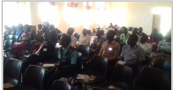
Nationale Alumni Konferenz – Lilongwe