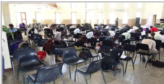
Aufnahmeprüfung für neue Studenten

Wir entsenden weltweit Fachkräfte in die Entwicklungszusammenarbeit.