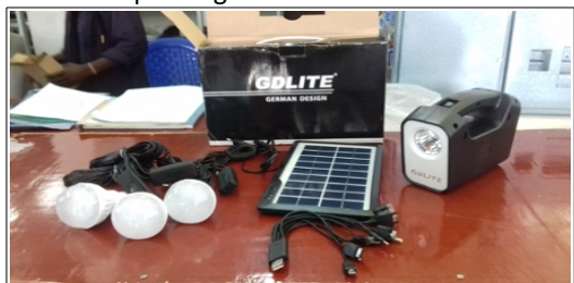
Solar Lampen Projekt