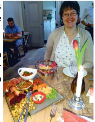
"Humor in der Ehe" ein besonderer Abend für Paare am 15.03. im "Schlößle" >