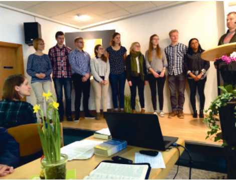
< Besuch eines Teams der Bibelschule Kirchberg im Februar