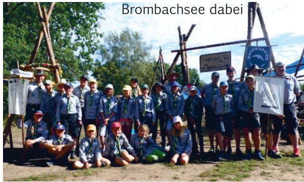
22 Kinder waren Ende Juli auf dem Pfadfindercamp am Brombachsee dabei