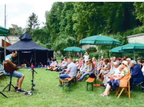
< Familien-gottesdienst im Pfadfindergarten am 23.06.